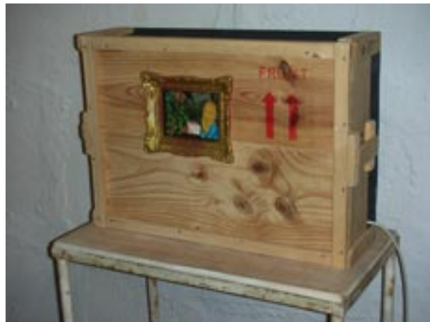
"Paisatge". Ensamblatge amb llum