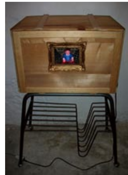
"Fútbol". Ensamblatge amb llum