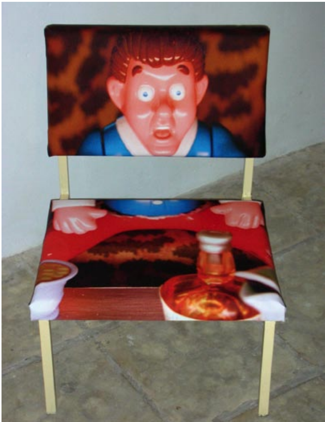
"Cadira futbolística" . Fotografia damunt canvas