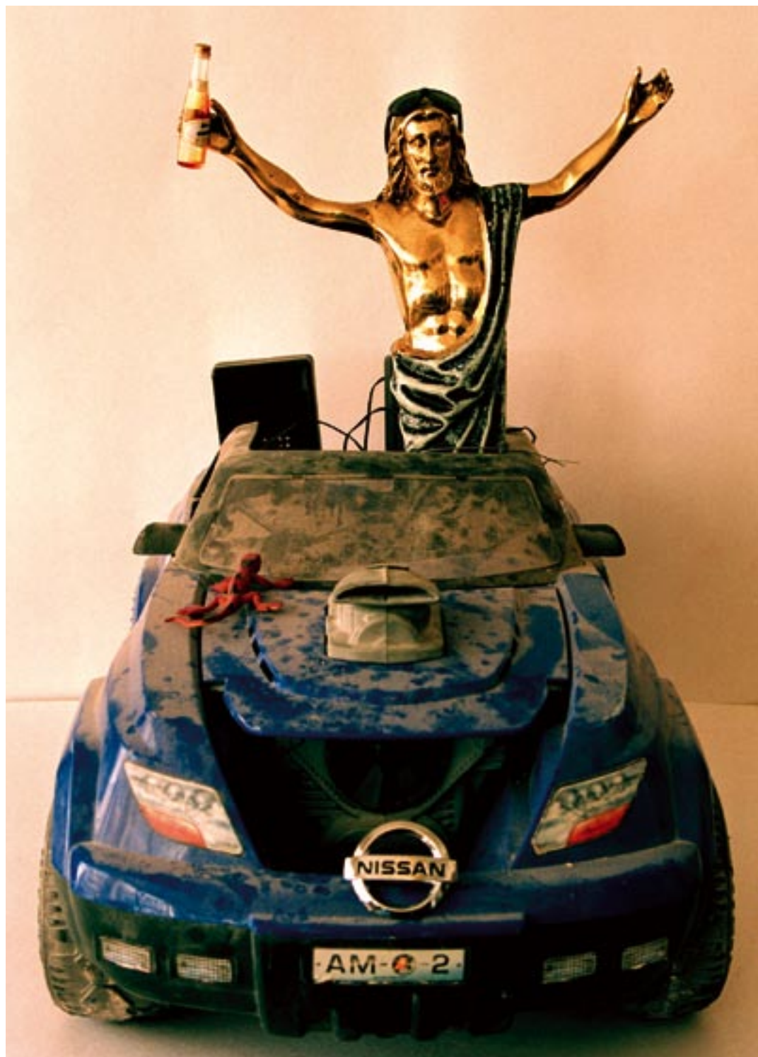
"Jesús de Formentera". Fotografia damunt canvas