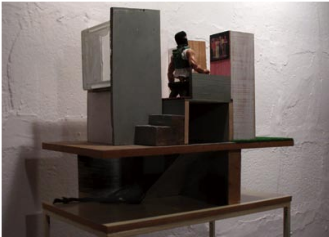
"La casa de fusta". Ensamblatge