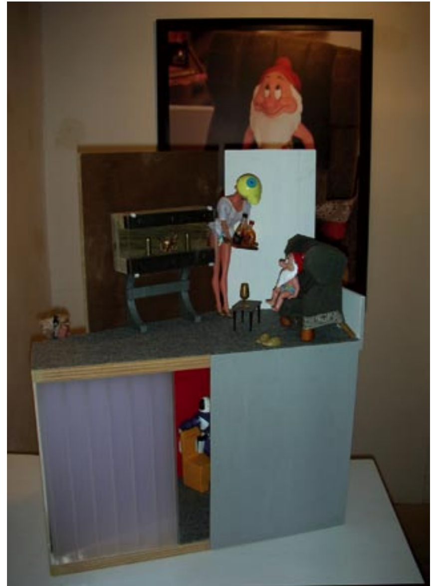
"Dolce vita". Ensamblatge