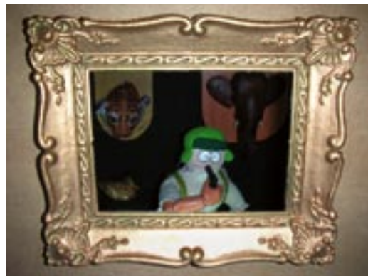
"El caçador". Ensamblatge amb llum